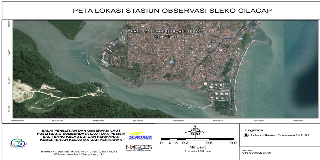
Gambar 1. Lokasi Stasiun Observasi Sleko